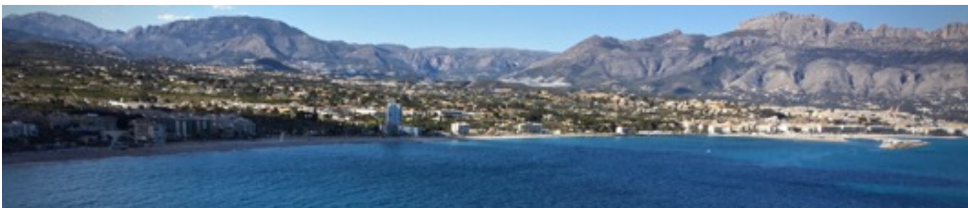
Albir og Altea sett fra Sierra Helada

Benytt anledningen til å utvide din kompetanse og oppnå sertifisering i flotte omgivelser som legger til rette for en effektiv kursgjennomføring.